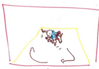
LE CHEVAL GALOPE AVEC UN TEXTE QUI VA TRÈS VITE