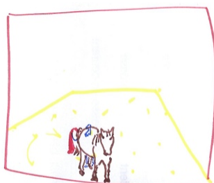
CACHÉE DERRIÈRE LE CHEVAL