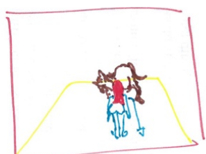
LE CHEVAL LUI BOUFFE LE CERVEAU